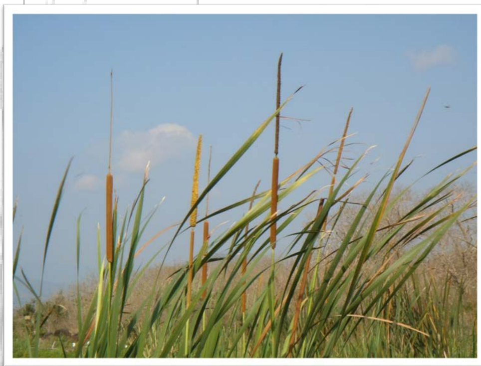
Typha domingensis .