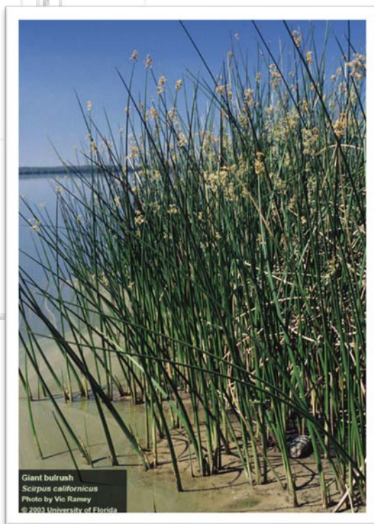
Imagen de Scirpus californicus .