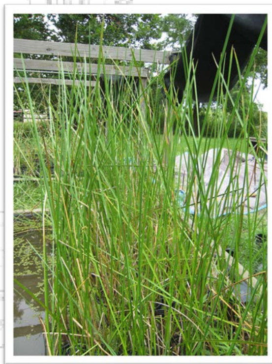
Imagen de Schoenoplectus americanus . Fotografía Naturalista.