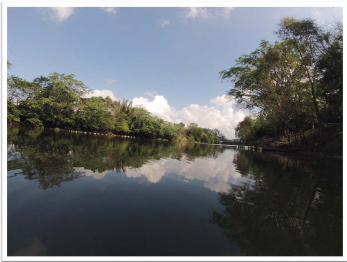
Vista del Río Cotaxtla.

Inundaciones costeras: Se presentan cuando el nivel medio del mar asciende debido a marea alta. Una surgencia por tormenta o tsunami permite que éste penetre tierra adentro en las zonas costeras, generando el cubrimiento de grandes extensiones de terreno. Los efectos de este tipo de inundación son estancamiento de flujo de agua de los ríos hacia la línea de costa, salinización de tierras y cultivos agrícolas.