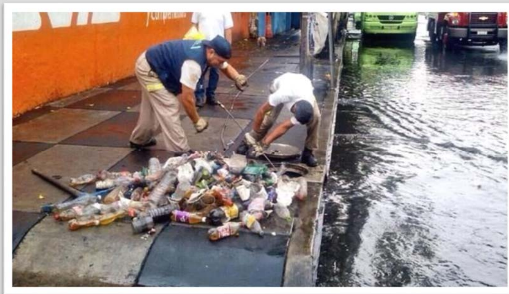
Foto: Limpieza de drenaje pluvial.

se infiltra. En condiciones urbanas el pavimento es impermeable y por tanto debe existir un drenaje pluvial (que generalmente no funcionan bien y/o se une al drenaje de aguas negras o se tapa con basura).